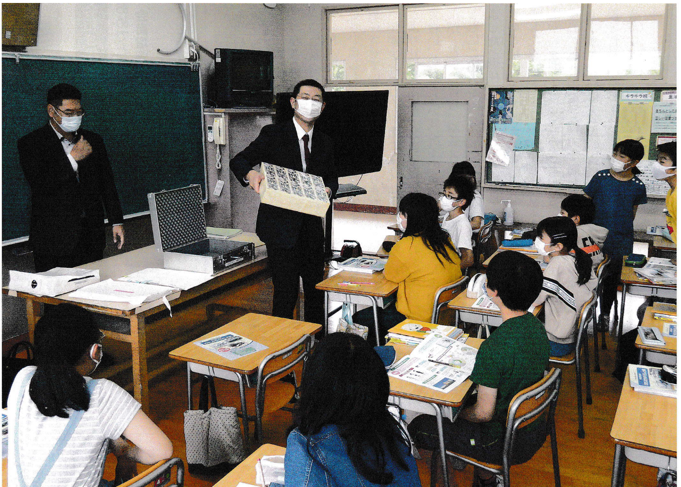
【青年部会：租税教室】 小学校13校 323名を対象に実施しました。